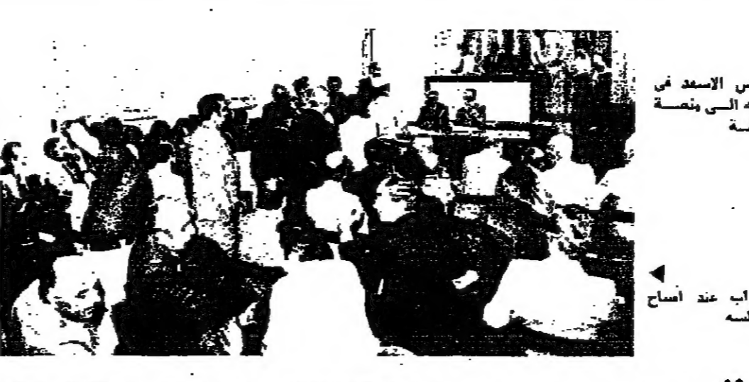
الرئيس السيد زهير بيضون مع رؤسائه في الاجتماع الخاص بالمشروع الذي حضره من بين اعضاء المجلس المركزي الدكتور محمد زكي ووزير السياحة المهندس زهير بيضون ورئيس مجلس ادارة الشركة طيار الشرق الأوسط - الخطوط الجوية اللبنانية الشيخ نجيب علم الدين وعدد من مسؤولي الشركة في الخبرة والمسؤولين من الوحدات في مطار بيروت الدولي . (تصوير موسى اللواتي)

وقال ان كلفة هذا المشروع تبلغ حوالي ٦٠ مليون ليرة لبنانية وان دراسات هذا المدرج هي جاهزة ودراسات جارية مع إحدى الشركات لتنفيذ الانشاء رضياً بحدود ٣٠ شهرا من تاريخ المباشرة بالعمل .